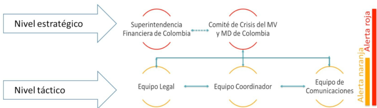
Gráfico 1 - Estructura de Gobierno

En los órganos de gobierno participan los funcionarios designados por cada uno de los proveedores de infraestructura que son parte de este Protocolo. Según lo estimen necesario o conveniente, los órganos de gobierno del Protocolo podrán invitar a personas externas, asesores, o representantes de terceros, incluyendo los MAPs.