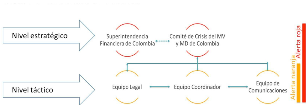
Gráfico 1 - Estructura de Gobierno

En los órganos de gobierno participan los funcionarios designados por cada uno de los proveedores de infraestructura que son parte de este Protocolo. Según lo estimen necesario o conveniente, los órganos de gobierno del Protocolo podrán invitar a personas externas, asesores, o representantes de terceros, incluyendo los MAPs.